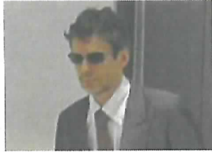
アイプロスマートHD